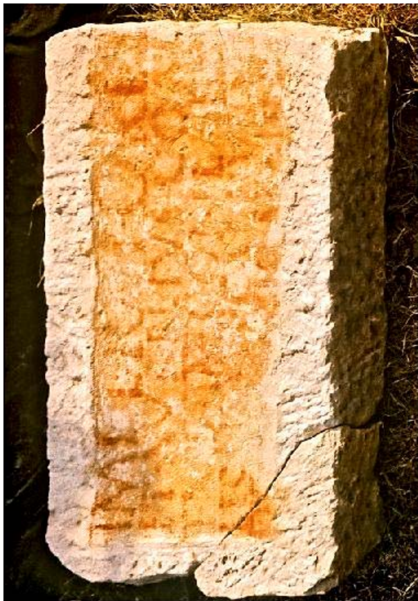
Ryc. 1. Malowana inskrypcja (titulus pictus) z Novae. Stan z roku 1978.