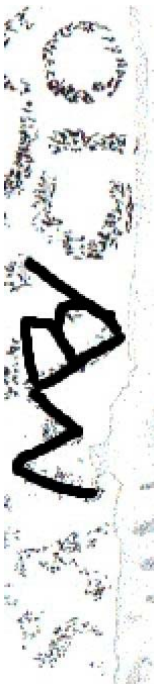
Ryc. 3. Ligatura MBV. Propozycja Danuty Okoń